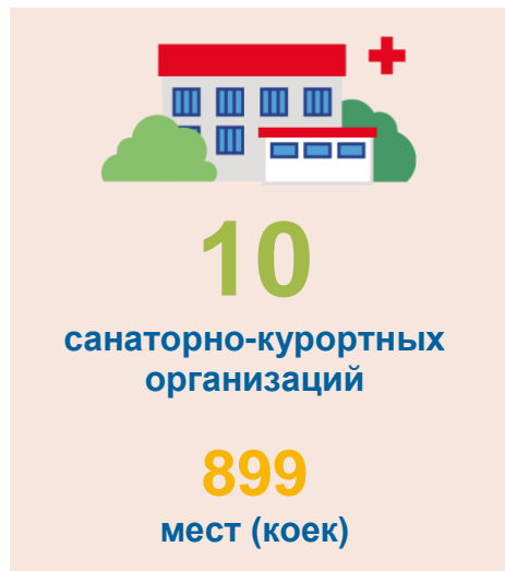
Численность обслуженных лиц человек